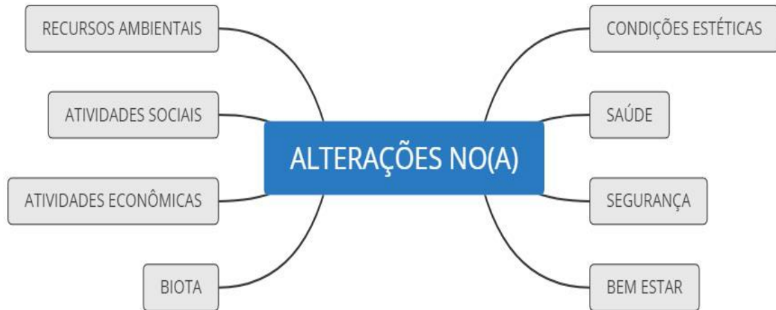
Figura 2 - Definições de impacto ambiental pelo CONAMA.

gerando por meio de suas ações o surgimento de produtos ou serviços de uma corporação.