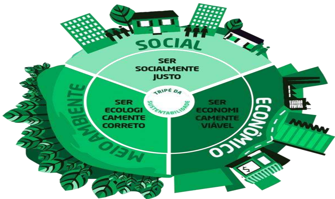
Figura 5 - Tripé da sustentabilidade.

O conflito vinha, de fato, arrastando-se por mais de vinte anos, em hostilidade aberta contra o movimento ambientalista, enquanto este, por sua vez, encarava o desenvolvimento econômico como naturalmente lesivo e os empresários como seus agentes mais representativos, contradizendo o tripé da sustentabilidade na figura 5.