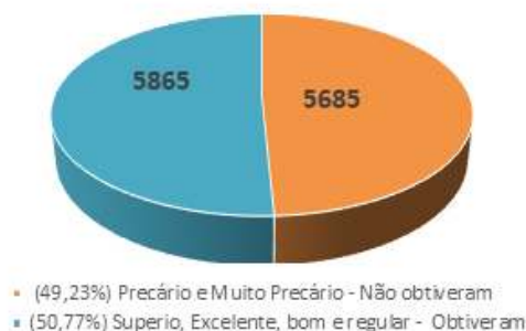
Gráfico 3 – Relação dos aptos no TAF PMPR que obtiveram ou não índices mínimos de aptidão física, conforme parâmetros do ACMS.

Importante frisar que, em análise aos dados, foi possível perceber que aproximadamente metade dos militares que realizaram o TAF da PMPR, ou seja, cerca de 49,23% estão com a condição de aptidão física relacionada à saúde abaixo do mínimo definido pelo ACSM, visto que 2.793 militares (24,18%) foram classificados no índice definido como “precário” e 2.892 (25,04%) no índice “muito precário”