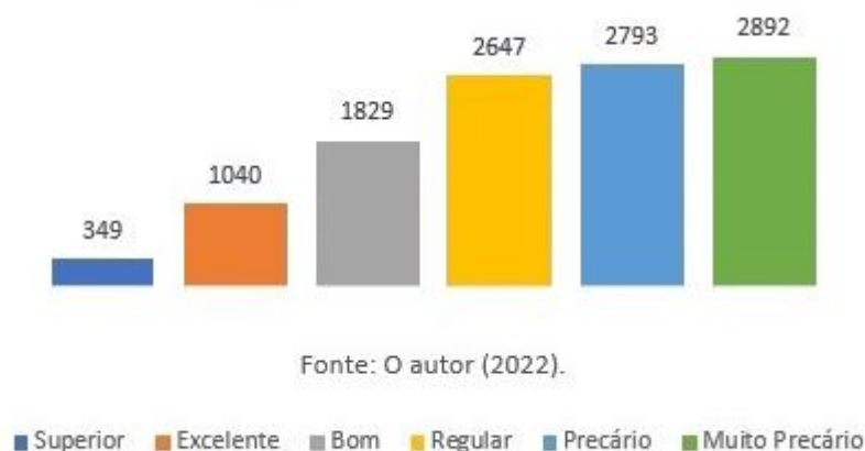
Gráfico 1 – Classificação dos índices da corrida de 12’ dos militares aptos no TAF da PMPR, segundo parâmetros da ACMS

Para melhor compreensão dos quantitativos analisados, o GRÁFICO 2 apresenta, assim como o gráfico 1, a classificação dos índices da corrida de 12 minutos de todos os militares aptos no teste, conforme os parâmetros do ACSM, porém em resultados percentuais.