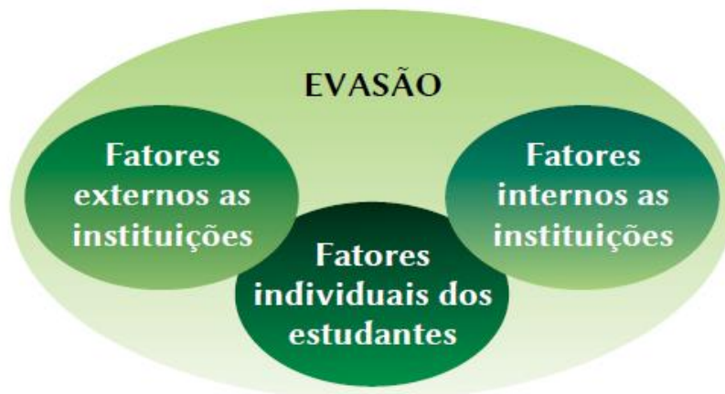
Figura 1: Fatores que influenciam na evasão