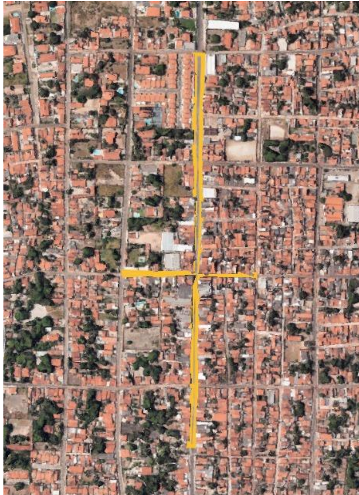
Figura 1 – Feira do Mangueirão.