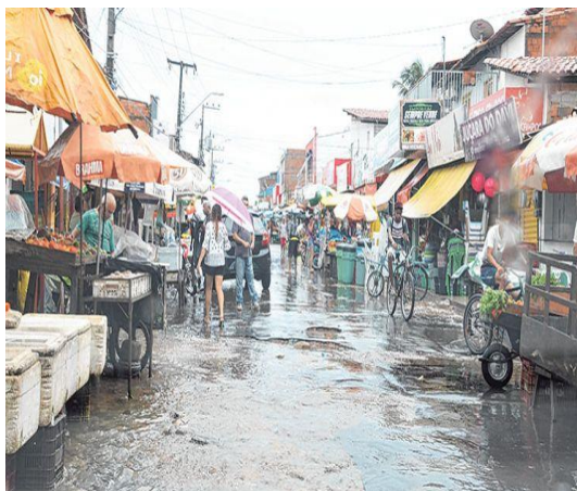
Figura 5 – Esgoto invadindo a área comercial.