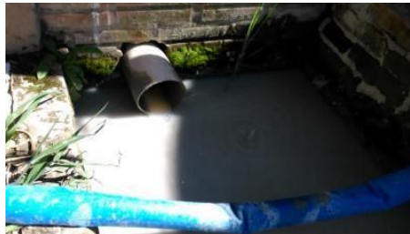
Figura 2. Entrada do decantador primário da ETE.

Tal efluente foi submetido à análise de turbidez, cor, sólidos suspensos totais, sólidos sedimentáveis, demanda química de oxigênio (DQO) e pH, além da análise de presença de coliformes. Antes de cada análise, o efluente foi homogeneizado.