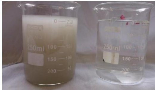
Figura 4. Fotografia do efluente tratado e do permeado.

A Figura 4 representa uma fotografia do efluente tratado em laboratório e do permeado proveniente da microfiltração transversal.