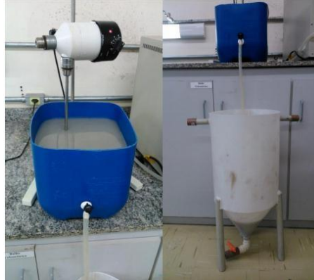
Figura 3. Homogeneizador e decantador em laboratório.