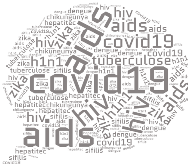
Imagem 1 - Frequência de palavras mencionadas sobre as principal(ais) doença(as) emergente(s) que os residentes tiveram contato no período em que estavam em suas atividades.

A partir da leitura das respostas percebeu-se as principais doenças emergentes vistas pelos Enfermeiros Residentes em sua prática profissional. Constata-se também os principais protocolos existentes na Unidade de Saúde e como se deu a adesão por parte da equipe de saúde envolvida no cuidado e acompanhamento dos pacientes. Nessa categoria temos 36OR. Os CS gerados nesta categoria foram: as principais doenças que os Residentes tiveram contato no período em que desenvolviam suas atividades (15OR), protocolos da unidade de saúde para lidar com as doenças emergentes (08OR), adesão da equipe de saúde da unidade quanto aos protocolos estabelecidos (13OR).