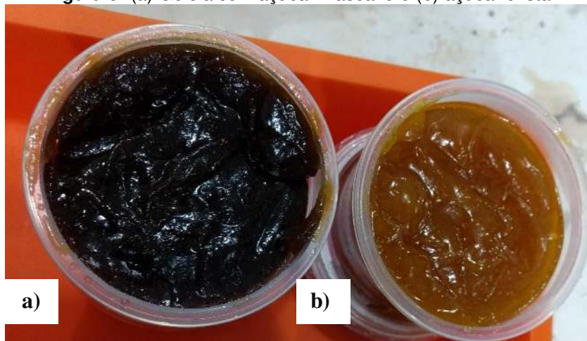
Figura 3: (a) Geleia com açúcar mascavo e (b) açúcar cristal

Essa diferença na coloração foi encontrada em estudo realizado por Oliveira et al. (2019) onde elaboraram geleia de achachairu, comparando formulações elaboradas com açúcar cristal e mascavo.