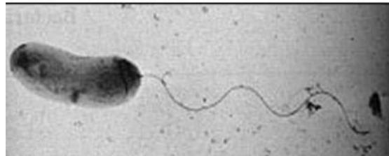
Figura 2. Vibrio cholerae

fixam na parede da mucosa epitelial do intestino delgado, podendo liberar toxinas responsáveis por desencadear a doença (MADIGAN, et al. 2016).