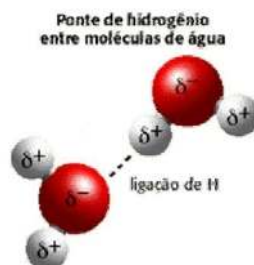
Figura 1. Molécula de hidrogênio e oxigênio

A partir do século XVIII, a água foi considerada um composto formado por 2 moléculas de hidrogênio e 1 de oxigênio. Esta apresenta uma estrutura molecular simples, com polaridade desigual devido à distribuição dos pares de elétrons. A atração entre as cargas positivas e negativas sucedem na ponte de hidrogênio (figura 1), resultando na ligação entre as moléculas que influenciam diretamente nos estados físicos em que a água se encontra, sendo eles: sólido, líquido e gasoso (GOMES; CLAVICO, 2005).