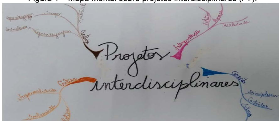
Figura 1 – Mapa Mental sobre projetos interdisciplinares (P7).

De uma forma geral, ao analisar os mapas mentais observamos as características enunciadas por Buzan (2019) para identificar um bom mapa mental, ou seja, os professores conseguiram representar e atender a esses critérios, que envolvem: ter uma temática central, ter ramificações grossas que partem do centro, com diferentes cores e sub-ramificações com uma imagem ou palavra-chave. A seguir apresentamos quatro mapas mentais construídos pelos professores no encontro 10: um envolvendo projetos interdisciplinares, 2 envolvendo a interdisciplinaridade e um envolvendo os projetos interdisciplinares em EA. Esses mapas foram escolhidos de forma aleatória. A figura 1 apresenta o mapa mental construído por P7.