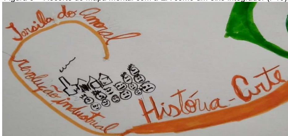
Figura 5 – Recorte do Mapa Mental com a EA como um eixo integrador (P10).

A figura 5 apresenta um recorte do mapa mental de P10 para mostrar o eixo integrador da EA (Figura 4).