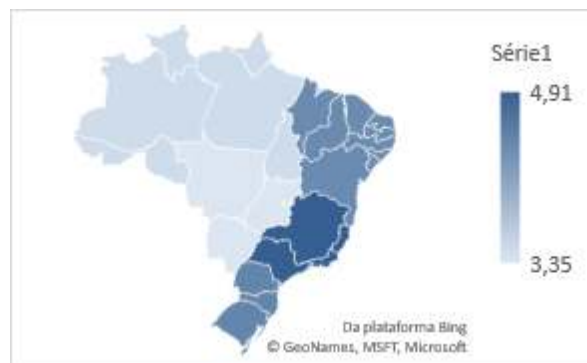
Gráfico 3-Taxa de incidência (por 10.000 trabalhadores) por grandes regiões brasileiras. Brasil, 2009-2016