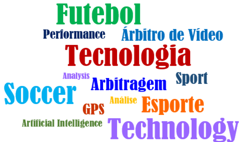
Figura 2 - Nuvem de palavras representando os elementos que mais se destacam nos trabalhos selecionados

ESTUDO DO IMPACTO DA ADOÇÃO DE TECNOLOGIAS DIGITAIS NO FUTEBOL José dos Santos Neto, André Almeida Silva