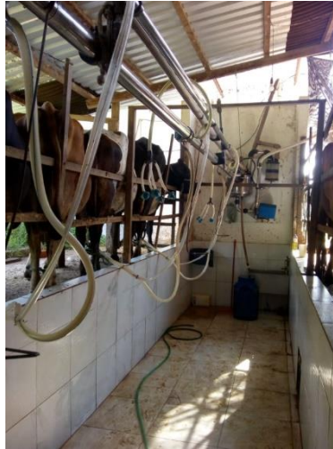
Figura 1 - Sala de ordenha equipada com ordenhadeira mecânica completa