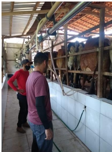
Figura 2 - Sala de ordenha