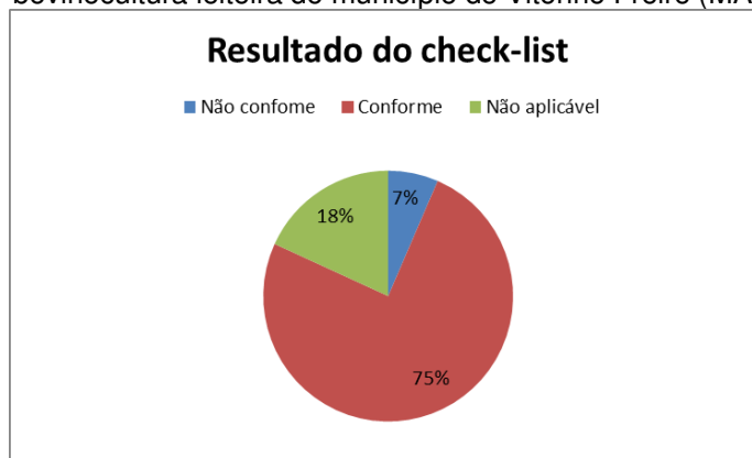
Gráfico 2 - Resultado geral em percentagem (%) do checklist aplicado em propriedade de bovinocultura leiteira do município de Vitorino Freire (MA)

Os resultados indicam que houve cerca de 75% de itens em conformidade, constatando-se 75% SIM, 7% NÃO e 18 % de NÃO SE APLICA, conforme mostra o Gráfico 2. Esses fatos podem ser considerados razoáveis, visto que, precisam de poucas adequações.