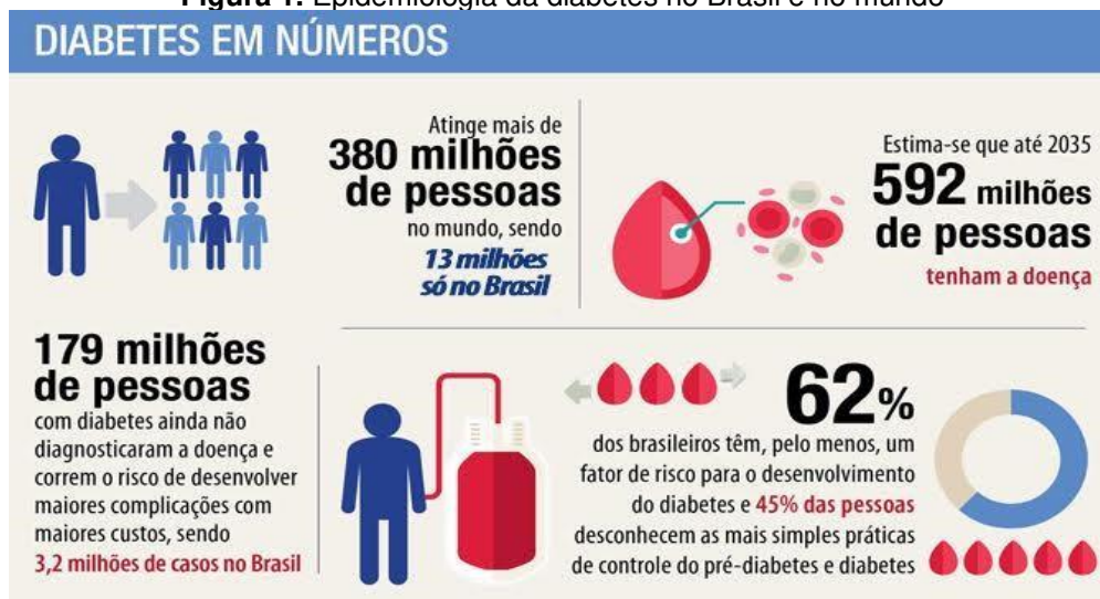
Figura 1. Epidemiologia da diabetes no Brasil e no mundo