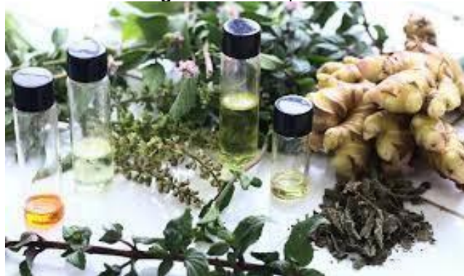
Figura 4. Fitoterápicos