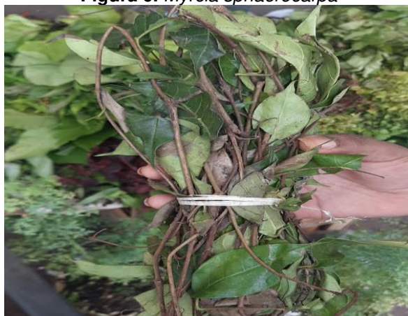
Figura 6. Myrcia sphaerocarpa

Nesse sentido, a Myrcia sphaerocarpa , ilustrada na figura 6, é utilizada como tratamento para a diabetes, devido suas alegações antidiabéticas, potencial hipoglicemiante e compostos como flavonoides e taninos. Tal planta possui atividades anti-inflamatórias, antioxidantes e antimicrobianas, principalmente na forma de extrato, é uma rica fonte de flavonoides, tais características explicam o uso tradicional da dessa planta para tratar diabetes, sendo uma fonte promissora de compostos biologicamente ativos (CASCAES et al. , 2015).