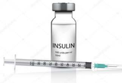
Figura 3. Insulinoterapia