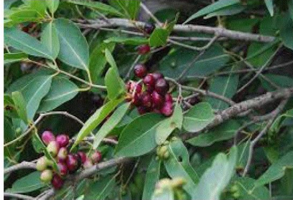
Figura 5. Syzygium cumini