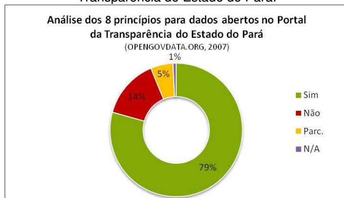
Gráfico 2 - Percentual de atendimento aos 8 princípios para dados abertos por consulta do Portal da Transparência do Estado do Pará.