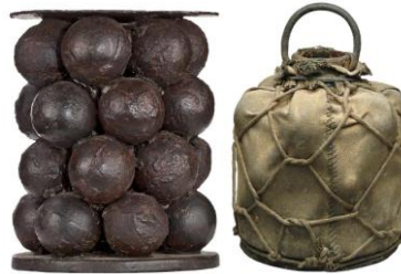
Figura 4 – "Grape Shot" , projéteis múltiplos usados em canhões