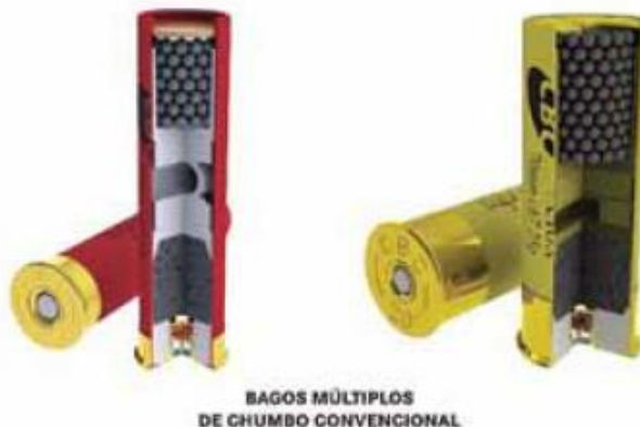
Figura 2 – Comparativo entre cartuchos de calibres diferentes e mesmo tamanho de chumbo