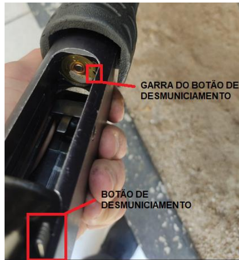
Figura 8 – Botão de Desmuniamento da Espingarda CBC PUMP Military 3.0 RT e sua garra

ASPECTOS GERAIS DAS CARACTERÍSTICAS DE CARTUCHOS DE ESPINGARDAS E SEU IMPACTO NO MANEJO DA ESPINGARDA CBC PUMP MILITARY 3.0 RT COM CANO DE 16" Daniel Keiny Cardoso