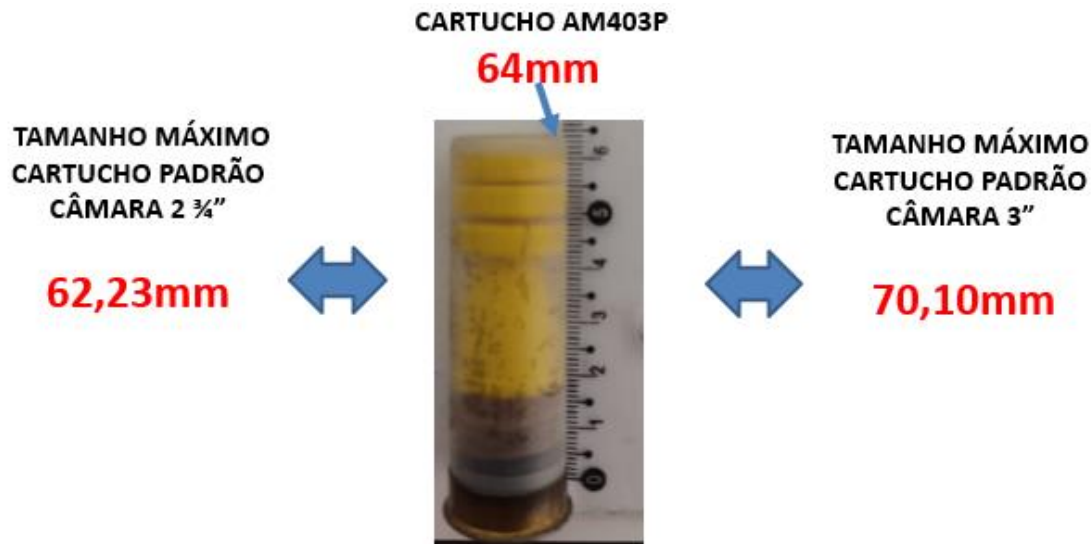
Figura 9 – Comparativo entre os padrões de tamanhos de cartuchos de armas de alma lisa e a munição Condor AM403P