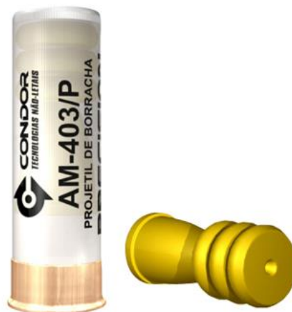
Figura 5 – Detalhe do Cartucho AM403P