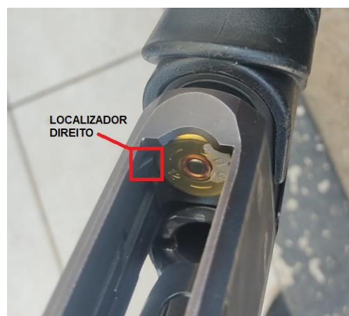
Figura 7 – Localizador Direito da Espingarda CBC PUMP Military 3.0 RT