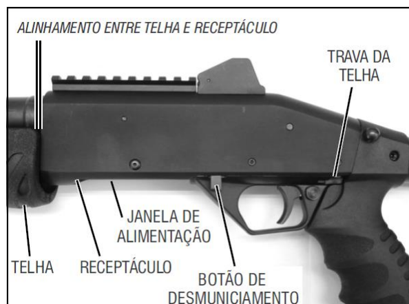
Figura 6 – Nomenclatura da Espingarda CBC PUMP Military 3.0 RT