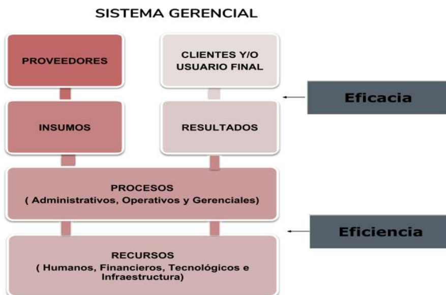
Figura N, 1 El Sistema Gerencial componentes.

GERENCIA DE GESTION RETOS Y DIFICULTADES: GERENCIA DE GESTION Y PLANIFICACION ESTRATEGICA DEL SISTEMA GERENCIAL DE LA ORGANIZACION Omar A Ferrer C