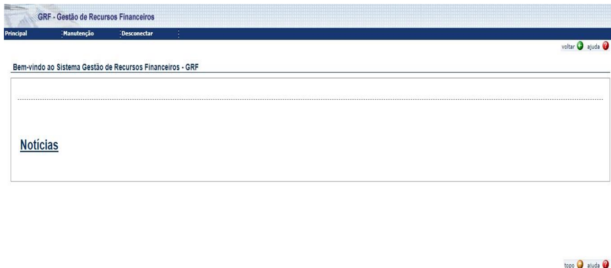
Figura 1: Sistema GRF