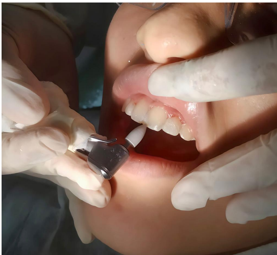
Figura 5 – Aspecto das restaurações definitivas pós-polimento, com o dente ainda desidratado.