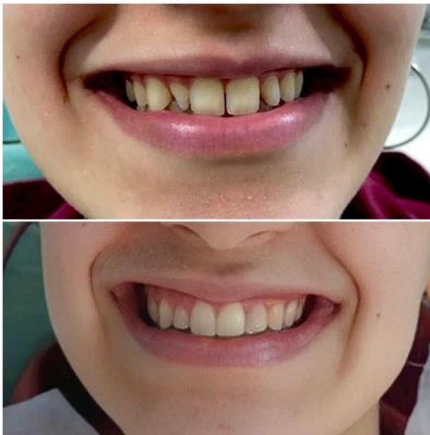
Figura 6 – Antes e depois.