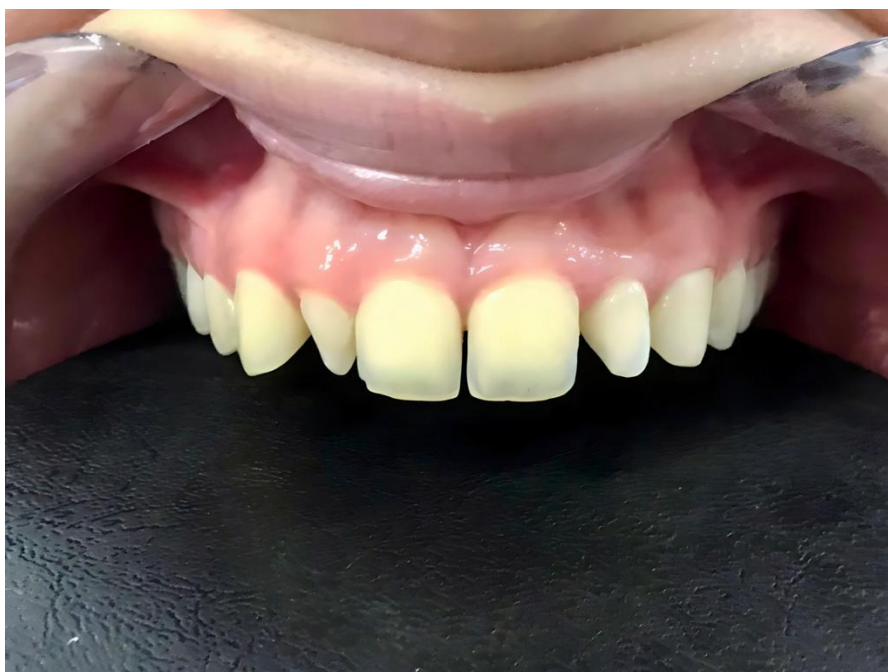
Figura 1 – Foto clínica do aspecto inicial.

de escolha foi A2 Z100 (3M ESPE®). Nas imagens 4 e 5 estão ilustradas a confecção das restaurações definitivas e o aspecto pós polimento das restaurações definitivas, com o dente ainda desidratado e a imagem 6 mostra o antes e depois.