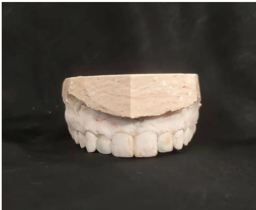
Figura 2 – Modelo com enceramento diagnóstico realizado.