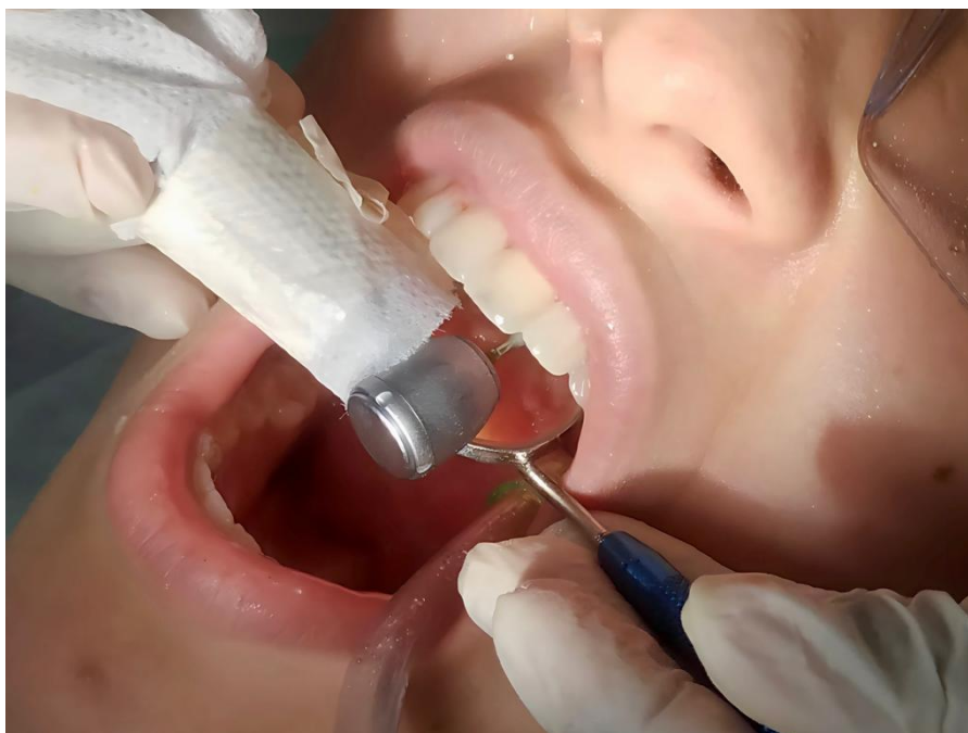
Figura 3 – Transferência do enceramento diagnóstico para a cavidade oral.