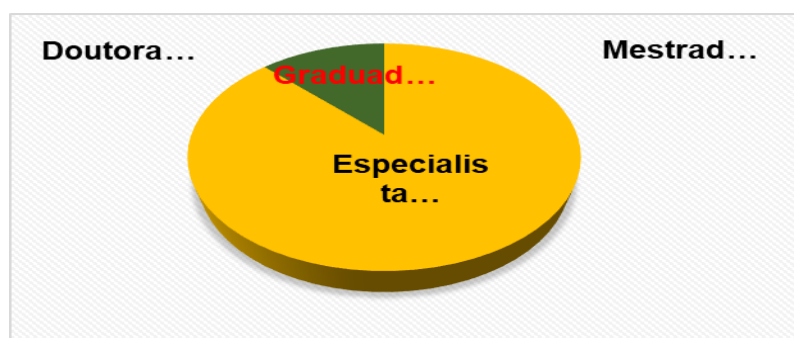
Gráfico 1- Formação do Professor da Escola