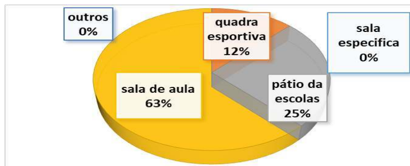
Gráfico: 3 - Espaço Físico Destinado as Aulas Ligadas as Atividades das Oficinas Pedagógicas