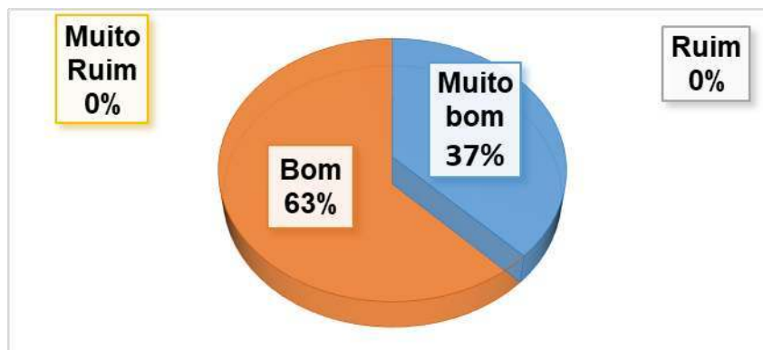
Gráfico 10- Satisfação com o resultado da aprendizagem do aluno pelo viés das oficinas pedagógicas