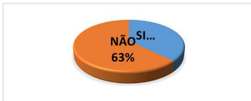
Gráfico 9 - Gestão x aplicabilidade de oficinas pedagógicas