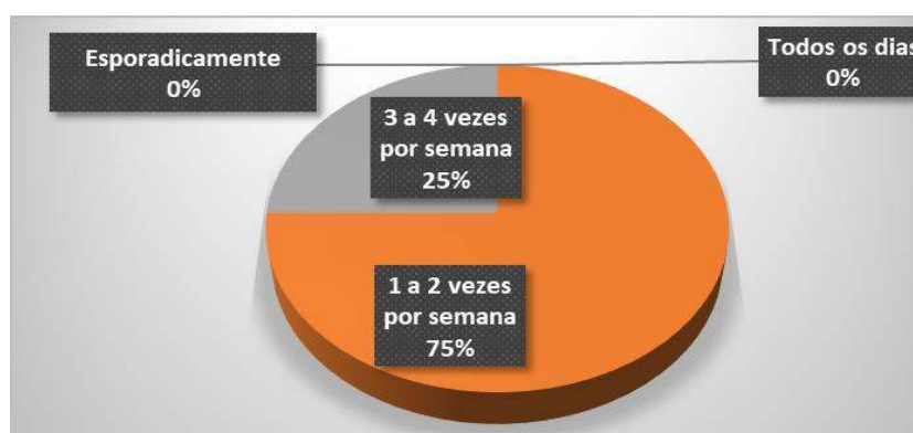
Gráfico 4- Frequência de trabalhas nas oficinas pedagógicas