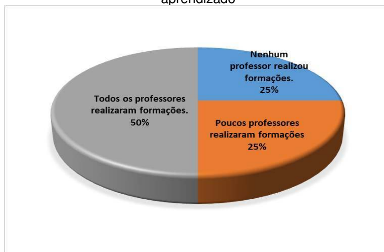
Gráfico 7- Formação acerca da aplicabilidade das oficinas pedagógicas no processo do ensino aprendido