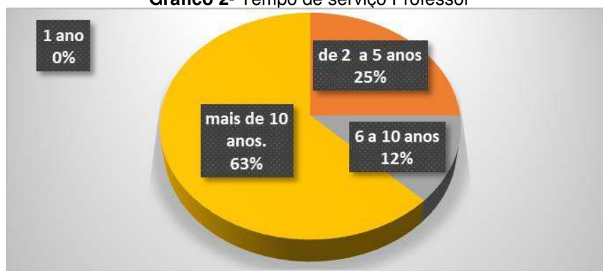
Gráfico 2- Tempo de serviço Professor