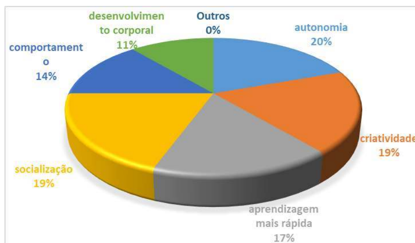
Gráfico 5- As atividades desenvolvidas nas oficinas pedagógicas favorecem o processo da aprendizagem da criança