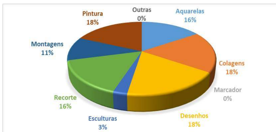
Gráfico 6- As crianças gostam das aulas quando se faz aplicabilidade do uso das oficinas pedagógicas