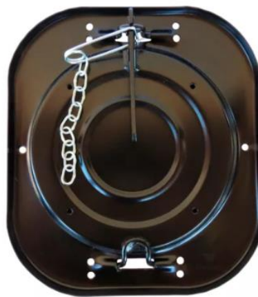
Figura 3 – Bica de escoamento de carga

A vazada é realizada pela facilidade em abrir a bica de escoamento da carga. Isso porque a bica é travada por uma simples peça metálica que, para abrir, basta puxar, sem maiores dificuldades, como fica visível na Figura 3 abaixo: