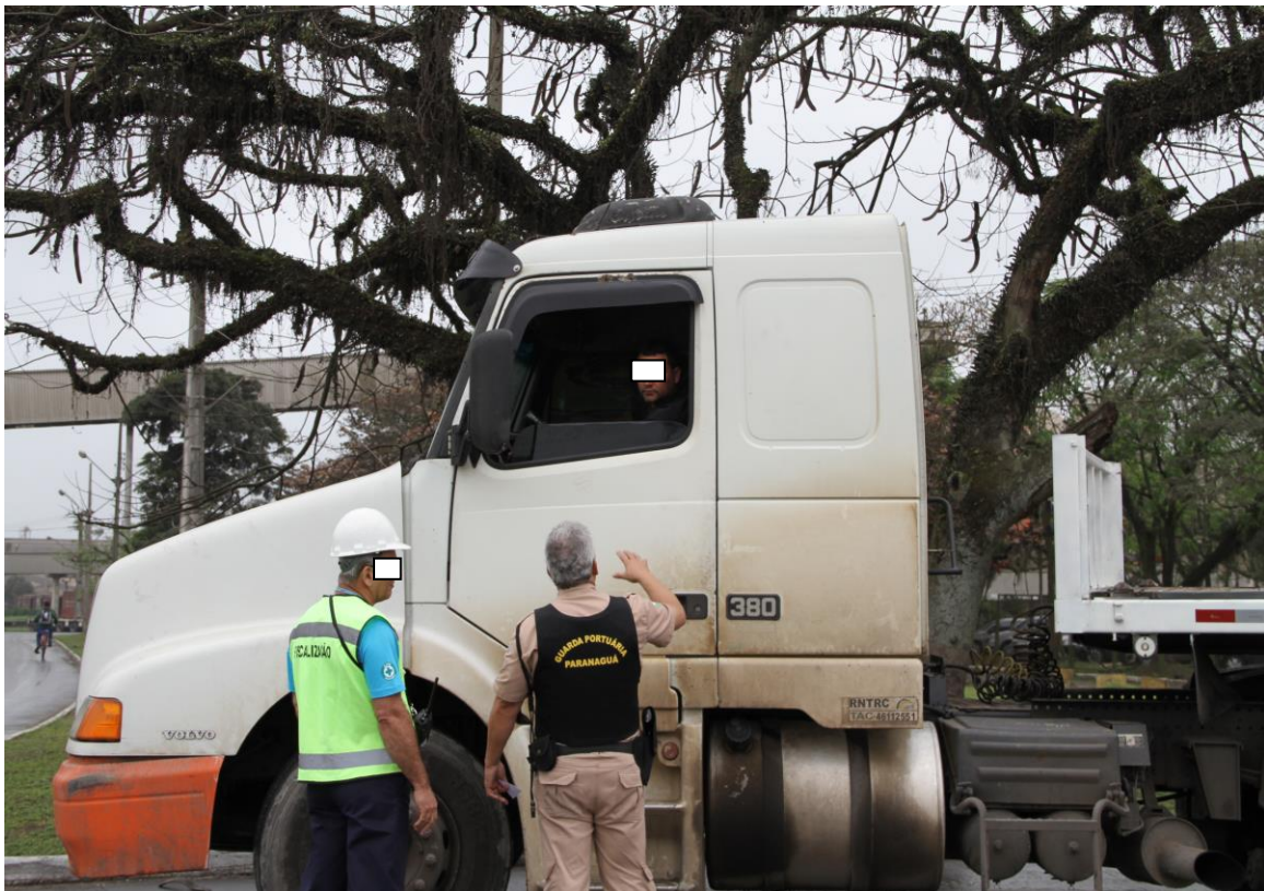
Figura 1 – Campanha Educativa realizada pela Guarda Portuária/Paranaguá

Na Figura 1 se verifica uma demonstração da atuação da Guarda Portuária: