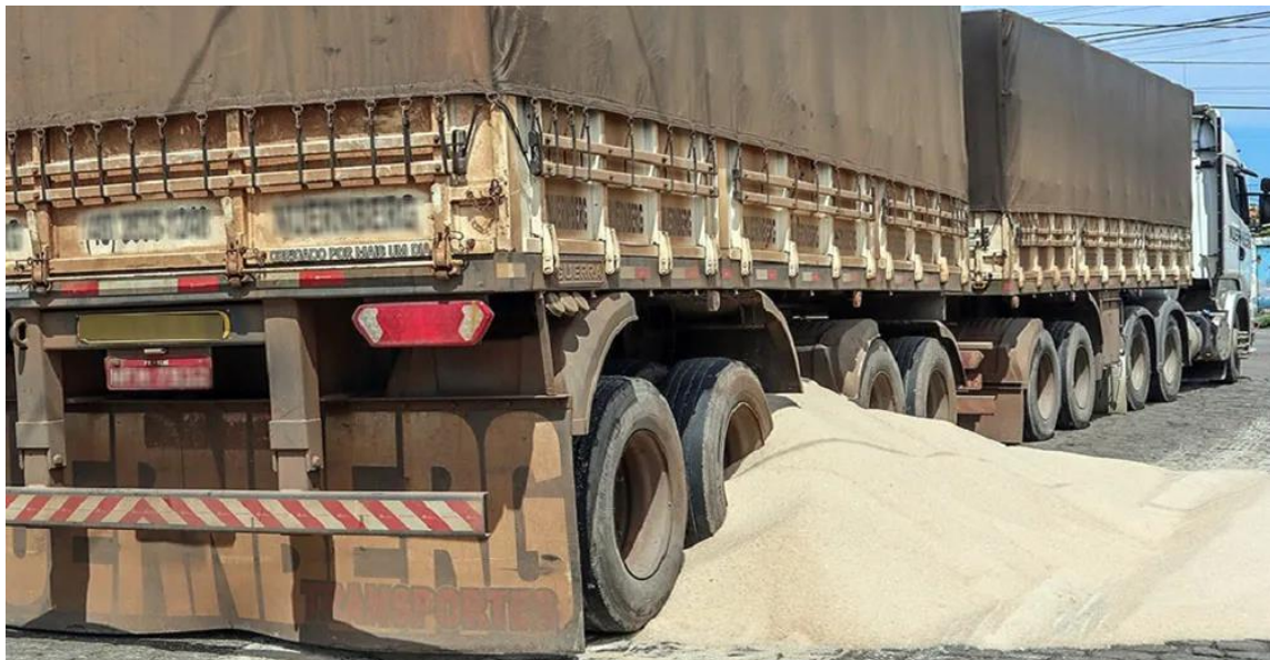
Figura 2 – Vítima de Vazada em Paranaguá

Para melhor entendimento, a Figura 2 retrata uma vazada: