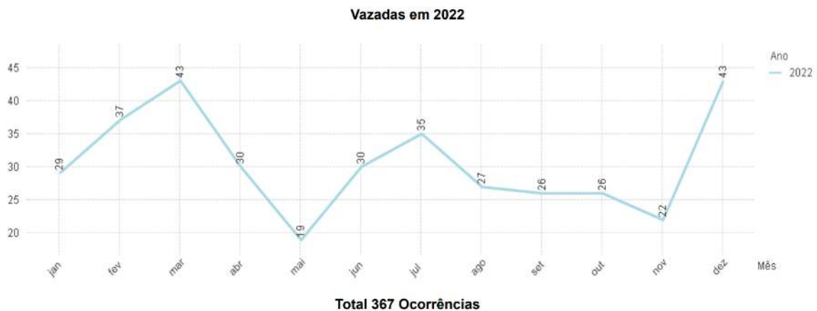
Figura 5 – Estatística de vazada no ano de 2022