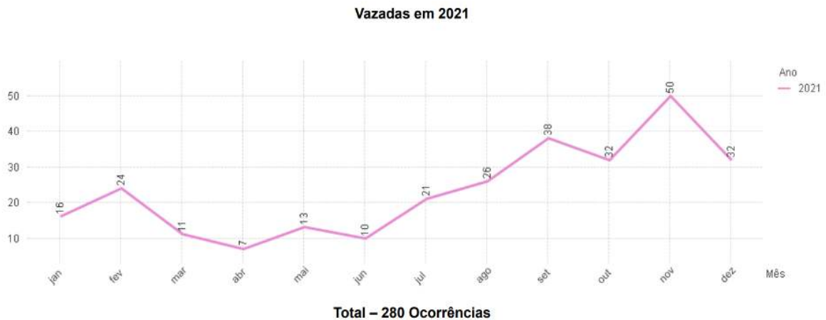
Figura 4 – Estatística de vazada no ano de 2021