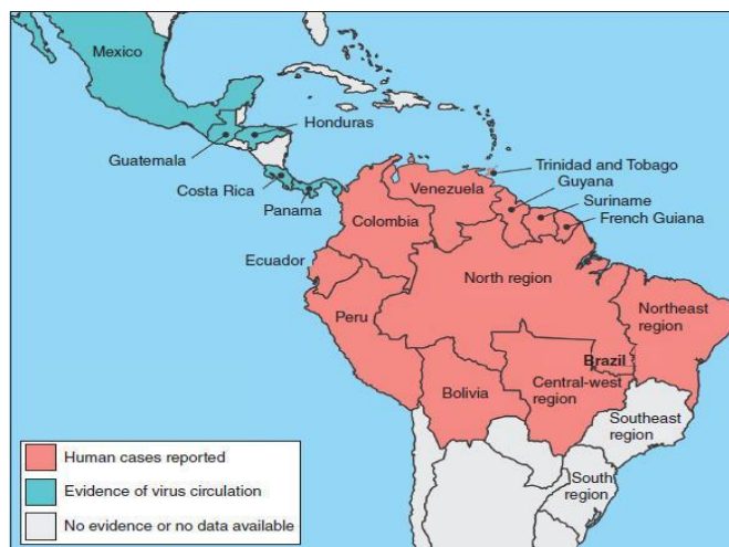
Figura 1: Distribuição do MAYV nas Américas. A figura mostra em vermelho as regiões em que há casos reportados de febre Mayaro ; em azul são as regiões em que há evidências da circulação do MAYV e em cinza são as regiões em que não há evidências ou não há dados disponíveis em relação à circulação do MAYV.

EPIDEMIOLOGIA DO VÍRUS MAYARO NA AMÉRICA LATINA DE 2009 A 2019 Elizabeth Regina Araujo de Barros, Rayllany Maylly Turbe Pires, Murilo Tavares Amorim, Gustavo Moraes Holanda