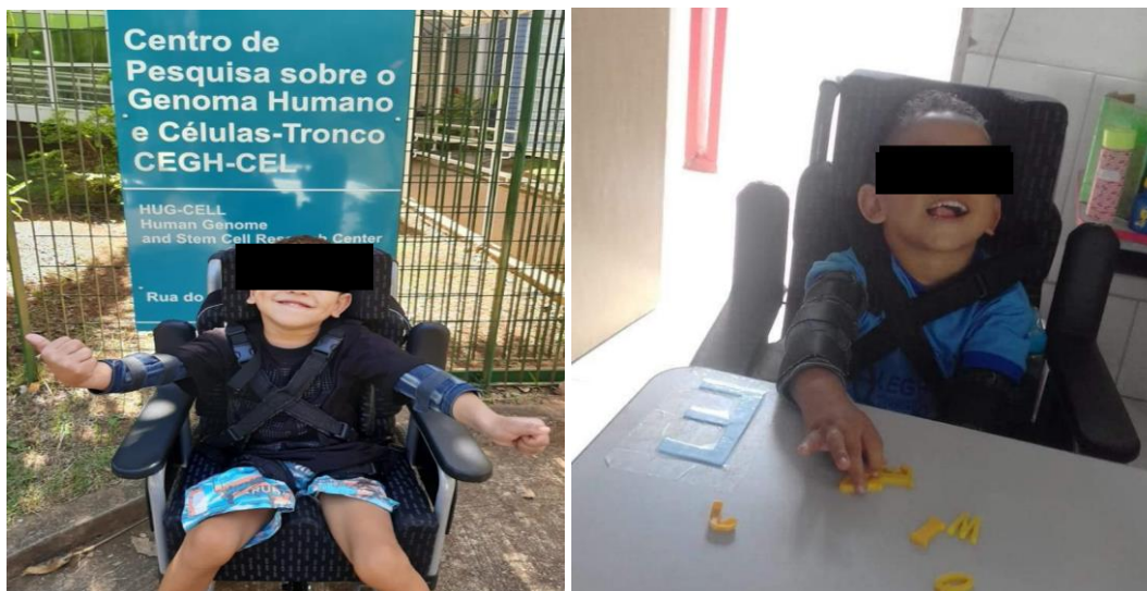
Figuras 2 e 3 – paciente sentado em dispositivo especial devido à hipotonia cervical