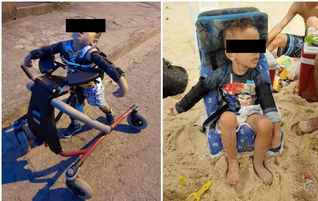
Figuras 4 e 5 – criança com braços imobilizados para evitar comportamentos autolesivos.

Por fim, aos 2 anos iniciou quadro de automutilação e comportamento agressivo, proporcionando uma especificidade maior ao possível diagnóstico.