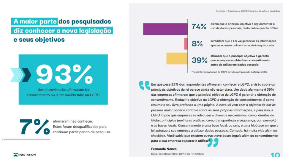
Figura 1. Manar, R. D. (2021, p. 10) - Empresas e LGPD: Cenários, desafios e caminhos

Os resultados das pesquisas de Manar (2021), revelam que uma grande parcela dos entrevistados, mais precisamente 93%, tem conhecimento sobre a existência da lei ou pelo menos já ouviram falar dela, já a pesquisa do SEBRAE Santa Catarina, esse número cai para 67.7%, lembrando que ambas as pesquisas foram feitas em 2021.