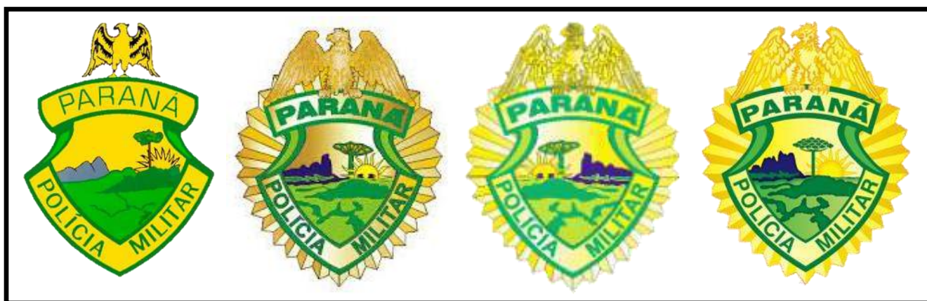
Figura 1. Brasões utilizados ao longo dos anos como símbolo oficial representativo da corporação

A marca da Polícia Militar do Paraná a qual denominamos “brasão” é o símbolo oficial representativo da corporação, conforme preconiza o Manual da Marca da PMPR. Ela já se apresentou como símbolo representativo da corporação em várias versões, dentre elas destacamos as seguintes versões, utilizadas a partir de 1969: