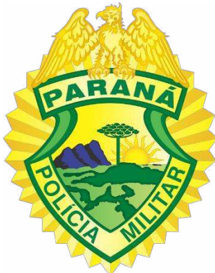
Figura 2. Atual brasão da PMPR 4

A última atualização deste brasão, realizada em 2018, se deu na reformulação dos desenhos representativos dos três planaltos, conforme é possível observar na imagem que segue, com indicação da alteração sob a arte na cor vermelha, elaborada pelos autores: