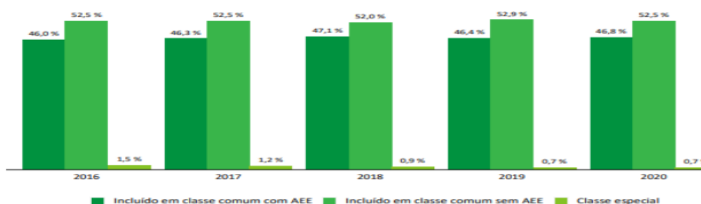
Gráfico 3 - Percentual de alunos matriculados de 4 a 17 anos com deficiência, transtornos globais do desenvolvimento ou altas habilidades frequentando classes regulares (com e sem atendimento educacional especializado (AEE) ou classes especiais exclusivas – Ceará – 2016 a 2020