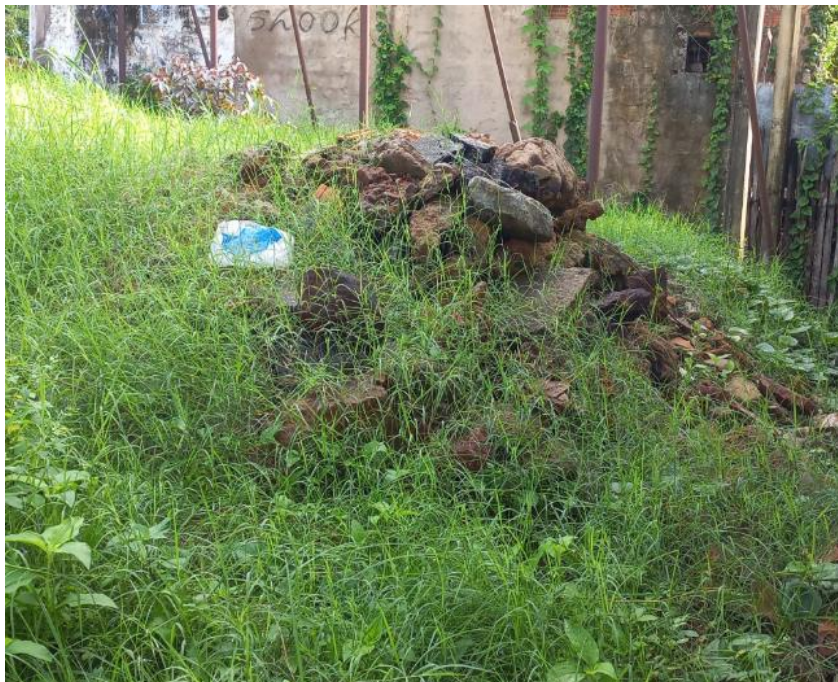
Figura 7 - RCC coberto por vegetação próximo ao Ecoponto da Jordoa

Dentre os pontos de descarte irregular de RCC, a figura 7 mostra um ponto ao lado do Ecoponto da Jordôa, apesar de alguns pontos já estarem cobertos por vegetação, dificultando a sua localização, é possível observar que, além do não conhecimento da população sobre os riscos ao meio ambiente quanto ao descarte incorreto destes resíduos, não há uma fiscalização em relação ao modo de operação de alguns Ecopontos, isso é notório devido os funcionários não relatarem ao Comitê Gestor de Limpeza Urbana (CGLU) sobre o volume de RCC presente ao lado do Ecoponto; pode-se constatar que a permanência desses resíduos nesses locais pode estar possivelmente ocorrendo por conta do grande custo para a sua retirada, devido ao seu grande volume, e a necessidade de contratar veículos pesados para a realização do trabalho.