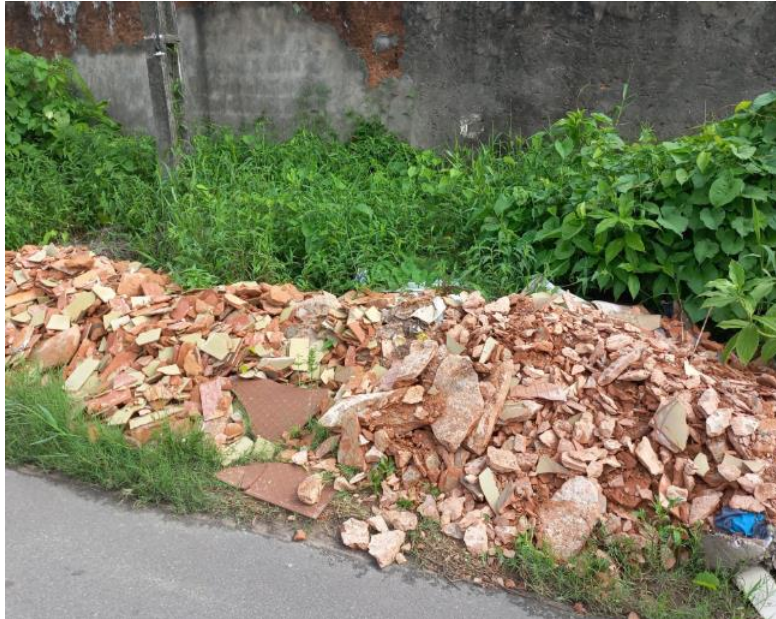
Figura 5 - Ponto de descarte irregular em uma calçada