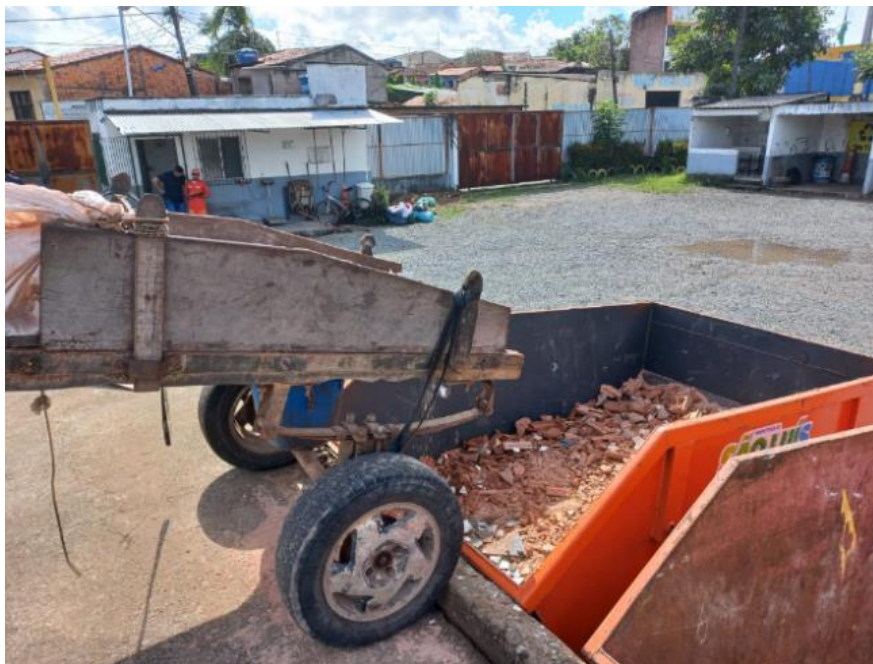
Figura 3 – Acondicionamento do RCC