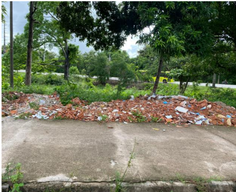
Figura 6 - Ponto de descarte irregular em via pública