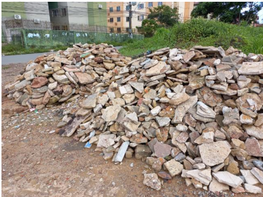
Figura 10 - Entulho disposto próximo a residências do Alto Angelim