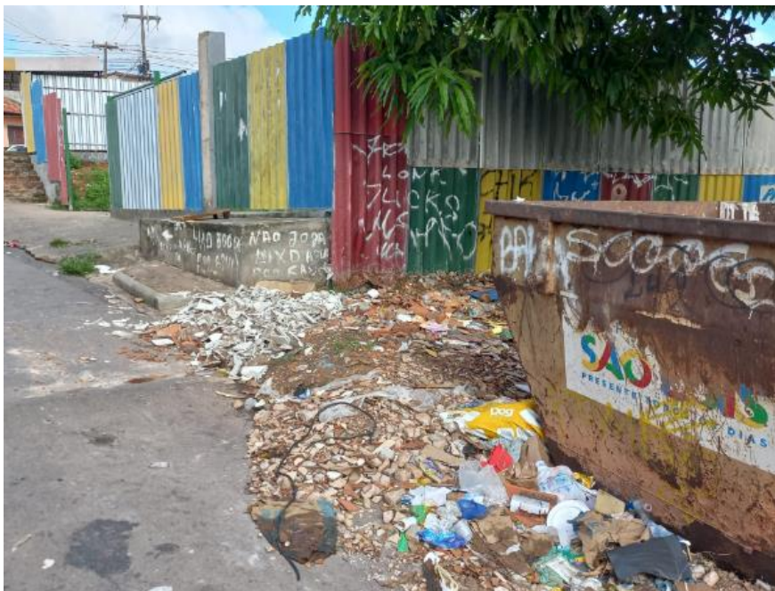
Figura 8 - RCC disposto ao lado do Ecoponto da Jordoa