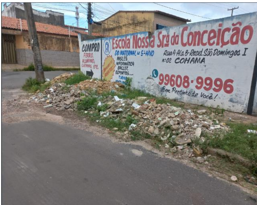
Figura 9 - Descarte irregular próximo ao Ecoponto Residencial Primavera

ECOPONTOS: UMA ANÁLISE DA GESTÃO DE RESÍDUOS DA CONSTRUÇÃO CIVIL NA CIDADE DE SÃO LUÍS - MA João Victor Corrêa Araújo, Deivid Araújo da Costa