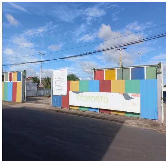
Figura 1 – Fachada do Ecoponto Residencial Primavera