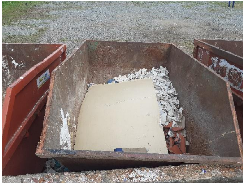
Figura 2 - Resíduo de gesso, cerâmica de revestimento e papelão acondicionados sem segregação

ferramentas mais frequentemente empregadas com o intuito de viabilizar a sua utilização (SCHNEIDER, 2003); através do beneficiamento e reciclagem deles.