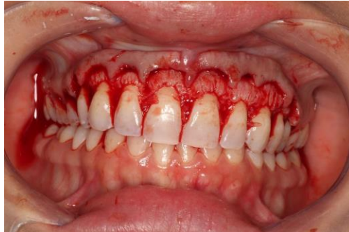
Figura 5 - Retalho do tipo envelope rebatido possibilitando visualizar o tecido ósseo da paciente