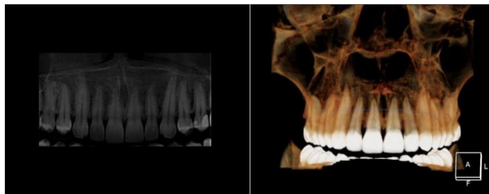
Figura 2 - Tomografia da arcada dentária superior da paciente, com tamanho real da coroa anatômica