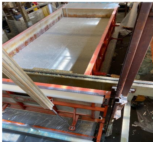
Figura 2: Máquina Cofama