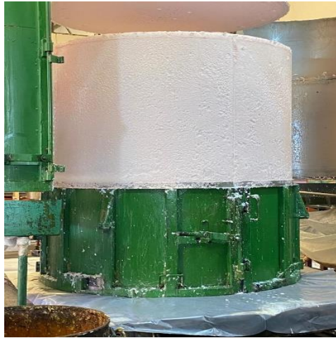
Figura 1: Máquina Flex