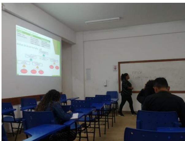
Figura 2 – Professora atribuindo as aulas de forma lúdica e contribuindo no quadro

Nessa perspectiva, as aulas tem melhorado muito com o passar dos anos, e no Ensino Técnico, podemos observar essas mudanças, pois, e de extrema importância essa evolução, o docente se preocupa em como vai atribuir as aulas de forma simples para que os discentes entendam, diferente de seus métodos, eles tendem a usar alguma ferramenta tecnológica para explorar a aula e passar o conteúdo de forma satisfatório e coerente para a compreensão dos alunos, conforme a figura 2 que mostra o ensino em sala de aula do ensino técnico.