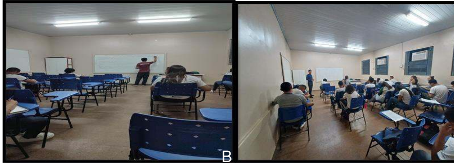
Figura 1 A-Momentos da observação/ B-Momentos da coparticipação