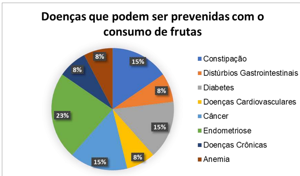
Gráfico 2: Doenças que podem ser prevenidas com o consumo de frutas