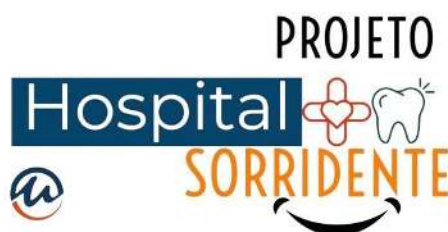
Figura 3: Identidade visual do Projeto Hospital Sorridente

No final do primeiro semestre do ano de 2022, foi solicitado pela Santa Casa de Misericórdia a elaboração de um projeto de extensão, para que professores e alunos, no âmbito do Sistema Único de Saúde, se incorporassem às equipes de terapia intensiva, realizando procedimentos de educação em saúde bucal, limpeza da cavidade oral, avaliação e diagnóstico odontológico, além do acompanhamento dos pacientes internados. Este projeto foi batizado de Hospital Sorridente (figura 3), o qual impulsionou a criação de um grupo de estudos em Odontologia Hospitalar (figura 4), no Centro Universitário de Patos de Minas. Os estudantes além de vivenciarem a prática da rotina hospitalar sob supervisão direta dos professores orientadores, tem conteúdos teóricos e treinamentos práticos realizados sob a égide das metodologias ativas de ensino-aprendizagem.