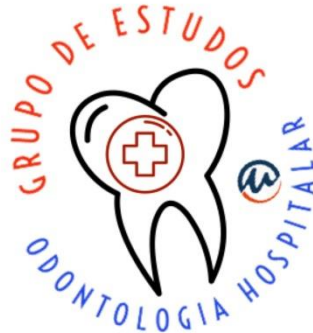
Figura 4: Identidade visual do Grupo de Estudos em Odontologia Hospitalar do UNIPAM