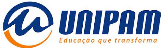
Figura 2: Identidade Visual do Centro Universitário de Patos de Minas e da Fundação Educacional de Patos de Minas