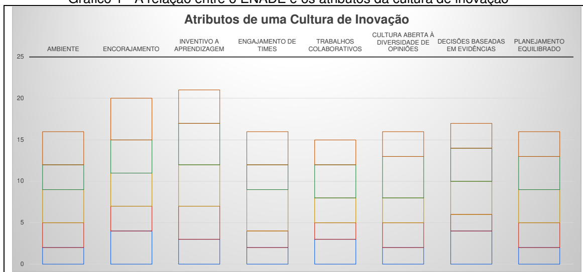
Gráfico 1 - A relação entre o ENADE e os atributos da cultura de inovação

A partir das orientações propostas pela ISO56002, uma cultura de inovação possui um conjunto sistemático de atributos que, quando considerados pela cultura organizacional, favorecem o desenvolvimento de um arcabouço organizacional que pode sustentar práticas inovativas. De acordo com a norma, identifica-se que o ambiente é um aspecto essencial, sobretudo pelo fato de que este espaço favorece o processo de compartilhamento de conhecimento, bem como as condições capacitadoras para o processo de criação de conhecimento, tal como indica Nonaka e Takeuchi (1999). Além do ambiente, o encorajamento e o incentivo a aprendizagem são dois pontos essenciais que criam um ambiente favorável a decisões criativas, promovendo ambientes em que o engajamento dos times é essencial, fomentando outras condições que são tratadas na norma. O Gráfico 2, a seguir, apresenta o movimento da percepção dos entrevistados em relação aos pontos específicos que se relacionam a cultura de inovação com o ENADE, sendo que os principais pontos podem ser identificados a seguir: