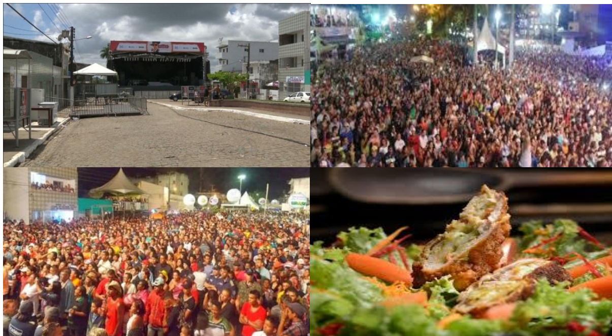
Figura 1. Local dos shows e da gastronomia em Areia – PB.

Tanto os programas como os livros didáticos escolares sempre deram ênfase às atividades dos homens ligadas às atividades mais tradicionais, ou seja, à mineração, à agricultura ou à indústria. Elas vêm sendo tratadas pela Geografia e eram consideradas mais importantes. No caso da indústria, se consideravam como atividade das mais modernas. Com frequência, definiam como países desenvolvidos, aqueles de maiores projeções industriais, enquanto que os países de economia agrária eram tidos como menos desenvolvidos ou de economia tradicional. Da mesma forma, os livros escolares didáticos sempre incluíam capítulos referentes à economia industrial, pois eram assim valorizados.