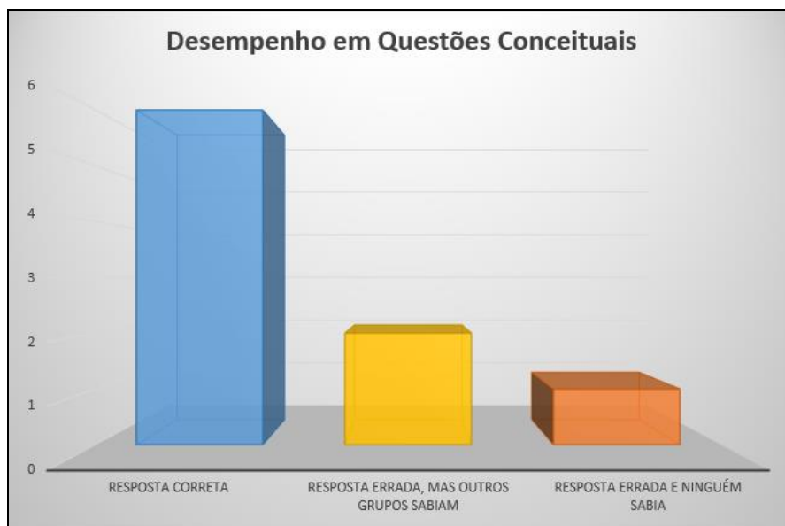
Figura 4: Análise de desempenho dos alunos na categoria conceitual