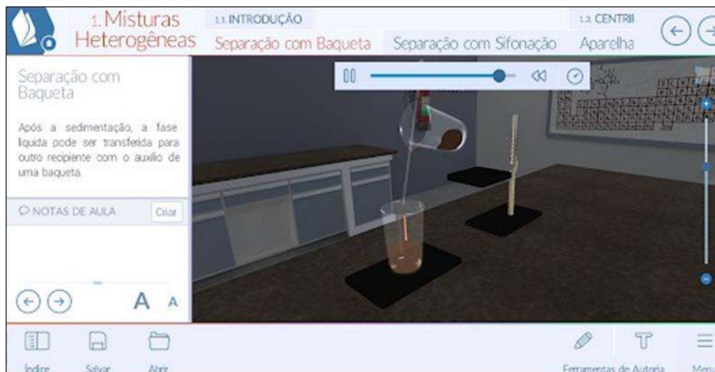
Figura 1: Interface do aplicativo Lab. de Misturas