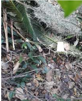
Figura 04 – Detalhes da serrapilheira e ação do homem no parque