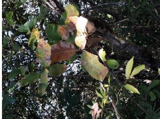
Figura 02: detalhes da vegetação no parque