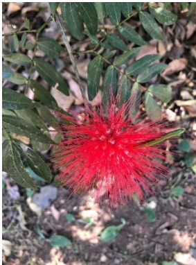
Figura 03: detalhes observáveis sobre a vegetação do parque