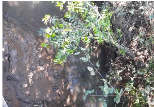
Figura 05 – Detalhe do rio contaminado pelo esgoto da cidade