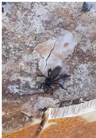
Figura 06 – Animais encontrados no parque

Na quinta estação solicitamos que os alunos observem os animais a sua volta, na figura 6 temos algumas espécies encontradas que podem ser observadas nesta estação. A grande variedade de animais pode ser trabalhada dentro da disciplina de ciências e ainda através do professor de artes com as cores dos animais, deve-se seguir uma discussão sobre a presença de animais ser algo bom ou ruim para o parque. Devem ainda ser trabalhadas as sensações que os estudantes percebem ao estar no parque, se o ar é mais puro e focar os benefícios que um parque traz para a sua cidade.