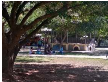
Figura 07 – Espaços para lazer no parque

Esta estação apresenta uma riqueza muito grande, espera-se que o grupo de professores traga para a discussão, quanto o contato com a natureza nos deixa sintonizados e nos tira de nossa rotina diária.