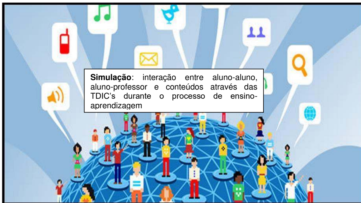
Figura 02: representa a interação entre os sujeitos (alunos e professores) e objetos (conteúdos e TDIC's)