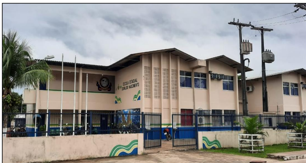
Figura 01 – Foto frontal da EEON

A escola possui (26) Professores; (01) Pedagogo; (01) Gestor; (01) Secretária escolar, (02) Agentes de Portarias, (01) Vigia, (05) Merendeiras, (03) Auxiliar de Serviços Gerais e (01) Auxiliar Administrativo.