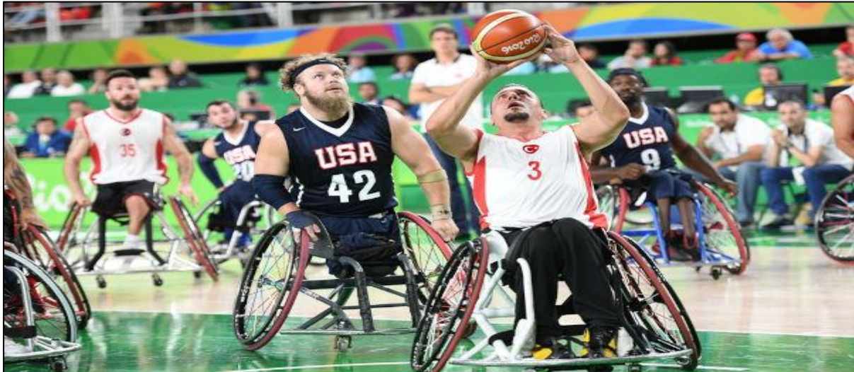
Figura 02 – Jogos paraolímpicos