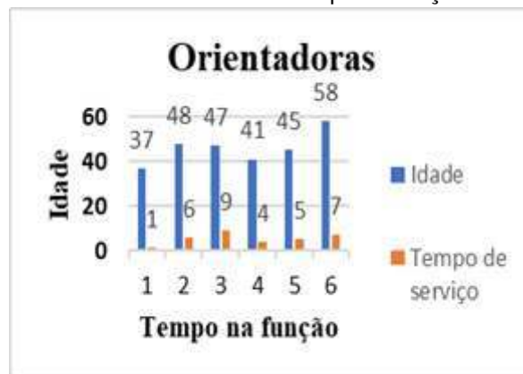
Gráfico 1 - Idade x Tempo na função

No município de Pinheiral (RJ), das 3 escolas 1 era municipal, Escola M1, e duas eram estaduais, Escola E2 e Escola E3. Já em Volta Redonda (RJ) 2 eram municipais, Escola M4 e Escola M5, e 1 estadual, Escola E6.