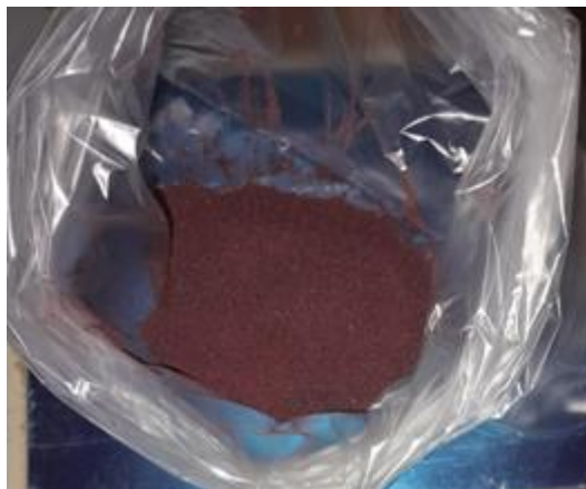
Figura 1. Imagem de beterraba em pó

Depois da secagem, pulverização e tamisação da beterraba, obteve-se um pó fino com odor característico e de coloração púrpura como se pode observar na figura 1.