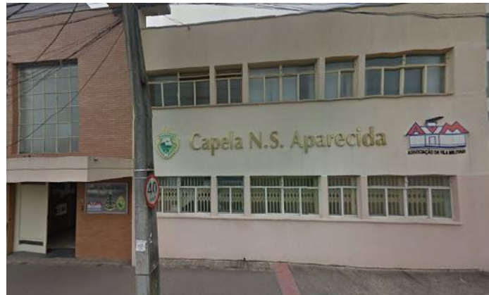
FIGURA 2 – CAPELA DA AVM