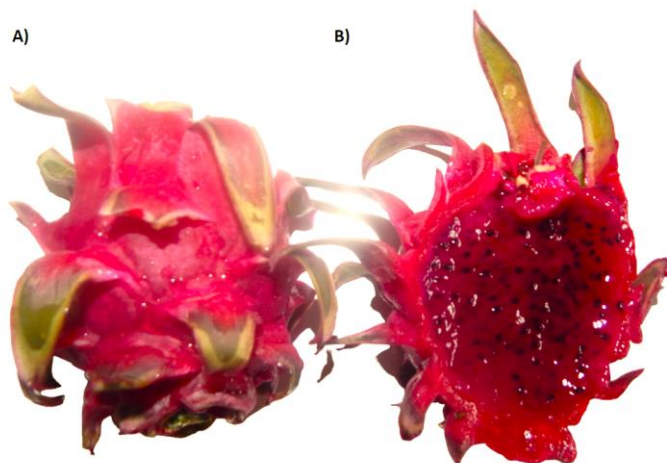
Figura 2. A) Fruto de Pitaia ( Hylocereus polyrhizus ); B) Fruto seccionado transversalmente; cultivada no Instituto Nacional do Semiárido, Campina Grande – PB

Os frutos de pitaia analisados no presente estudo possuem coloração roxa com as brácteas verde-roxa, indicativo da maturação dos frutos. Os frutos analisados possuem formato suavemente elíptico (Figura 2A), com polpa roxa, incrustada com sementes pequenas e de coloração preta (Figura 2B).