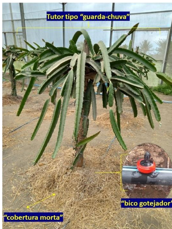
Figura 1. Tutor tipo “guarda-chuva”, Instituto Nacional do Semiárido, Campina Grande – PB

e foram conduzidos num formato de “copa” do tipo “guarda-chuva” conforme demonstrado na Figura 1.