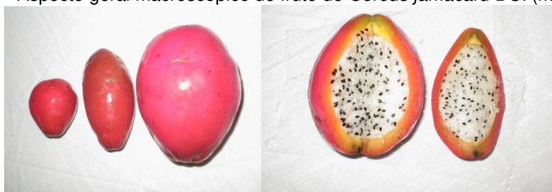
Figura 2 – Aspecto geral macroscópico do fruto de Cereus jamacaru DC. (mandacaru).

O fruto do mandacaru (Figura 2), possui sabor doce, aroma suave, polpa mucilaginosa branca e perecível, representando um obstáculo para sua comercialização in natura. Uma das alternativas a ser empregadas na conservação dos frutos do mandacaru é a secagem. As sementes de cor preta e bem pequenas, podem ser uma importante fonte de fibras e óleos comestíveis. Alguns estudos foram conduzidos com o fruto do mandacaru, objetivando elaborar produtos com valor agregado, a exemplo de bebidas fermentadas e fruta desidratada em pó (NUNES et al., 2013; OLIVEIRA et al., 2015; SILVA et al., 2019).