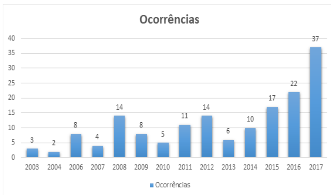
Gráfico 02: Ocorrências de caso de violência contra povos indígenas por ano.