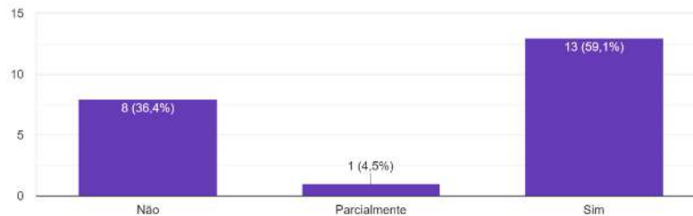
Figura 1 – Parecer da justiça favorável ao cirurgião dentista (n=22)