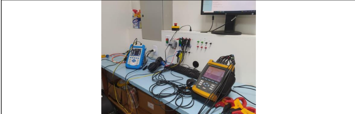
Figura 4- Medição dos dispositivos de automação no laboratório de Medidas Elétricas da UFMT