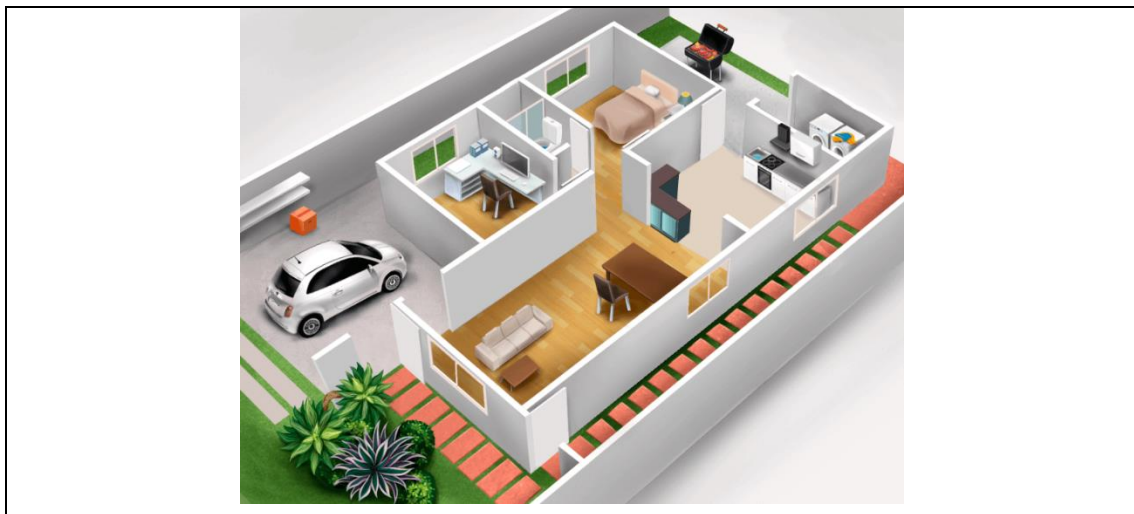
Figura 5- Planta da casa simulada

A residência simulada foi proposta pelo próprio simulador Museu Light , sendo essa utilizada para prosseguimento da pesquisa, a qual possui sete cômodos, sendo eles: 2 quartos, 1 sala, 1 cozinha, 1 banheiro, 1 escritório, 1 lavanderia e 1 garagem, como pode ser visto na Figura 5.