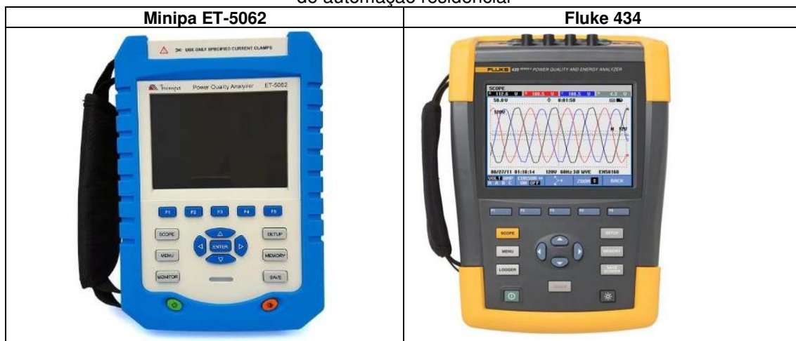
Figura 1- Equipamentos utilizados para aferição de consumo de energia elétrica dos equipamentos de automação residencial

Para realizar as medições precisas, foram selecionados dois equipamentos de medição que possuem capacidade de monitorar o consumo em tempo real, além de registrar as informações em memória de massa, com intervalo mínimo de registro de 2 segundos. A Figura 1 ilustra os dois analisadores de energia utilizados, o primeiro da marca Minipa, modelo ET-5062 e o segundo da marca Fluke, modelo 434, ambos do laboratório de Medidas Elétricas do curso de Engenharia Elétrica da Universidade Federal de Mato Grosso. Os equipamentos ilustrados na Figura 1 são capazes de registrar o consumo de energia elétrica ativa e reativa, corrente, tensão, potências e fator de potência dos aparelhos de automação sob ensaio.