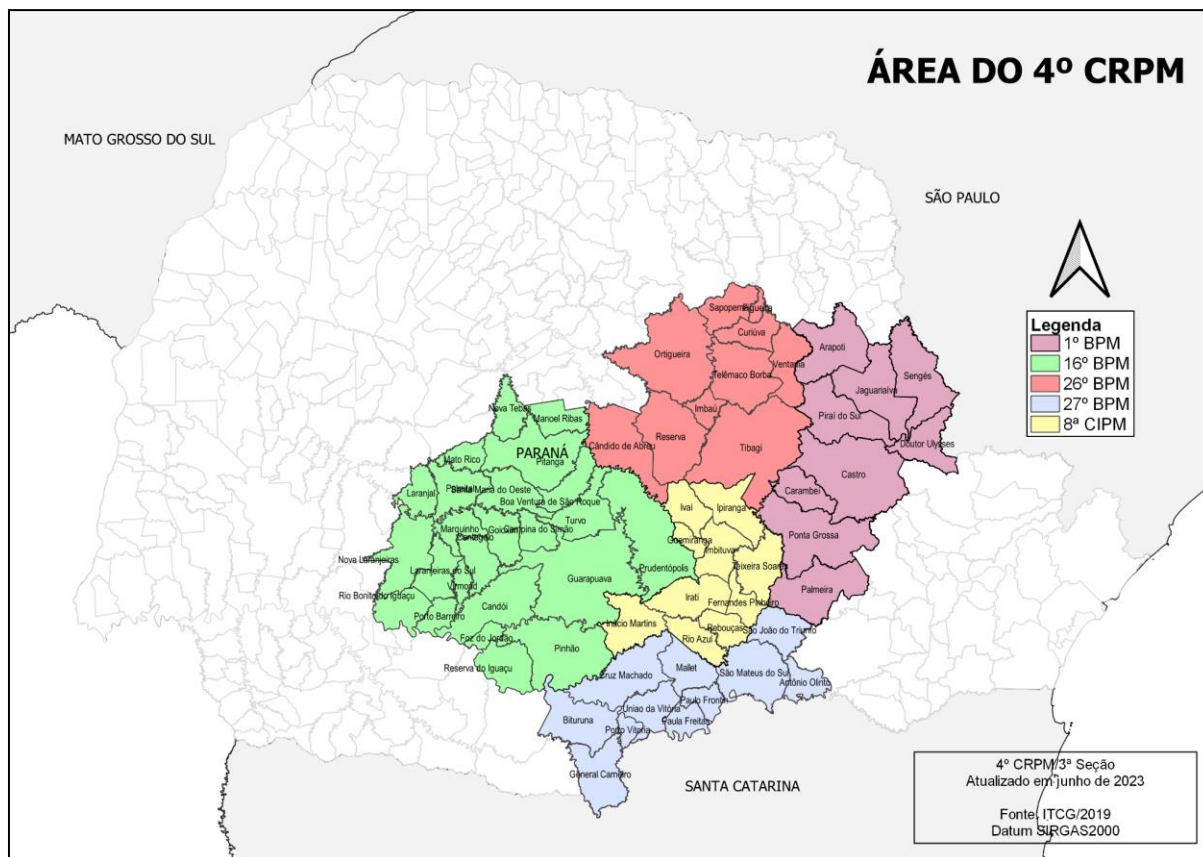
FIGURA 1 - Delimitação da 4ª Região PM