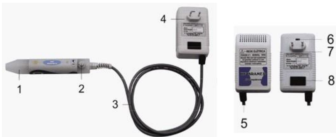
Figura 1. Componentes do aparelho de alta frequência

No procedimento de aplicação de ozônio por alta frequência são utilizados alguns aplicadores, denominados “canetas”, ou “canetas de HF” ( high frequency , na sigla em inglês), que se conectam aos eletrodos de vidro (Figura 2.). A depender se o procedimento será de tratamento facial, capilar, corporal ou de podologia, há diversos formatos de eletrodos que se adaptam ergonomicamente a diversos formatos de superfície. Ou seja, essa variedade se deve unicamente a questões de função anatômica, uma vez que exercem função idêntica. 14