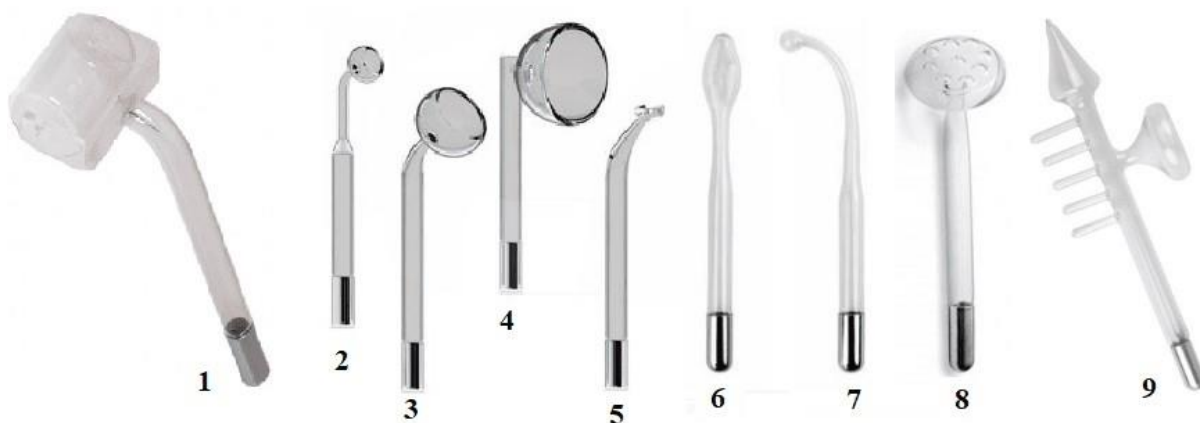
Figura 4. Formatos de eletrodos de vidro menos utilizados

Existem, entretanto, formatos de eletrodos utilizados com menos frequência, mas que possuem especificidades em determinados contextos de aplicação (Figura 4.): “1. eletrodo tipo rolete; 2. tipo cachimbinho; 3. cachimbo médio; 4. cachimbo grande; 5. rabo de peixe (ou rabo de baleia); 6. tipo língua; 7. tipo cogumelo; 8. tipo chuveiro; eletrodo conjugado 3 em 1.” 16 . Tal qual os exemplos supracitados, a variedade de formatos de deve à necessidade de cobrir a maior diversidade possível de peculiaridades anatômicas, não havendo nenhuma diferença significativa no que concerne à eficiência.