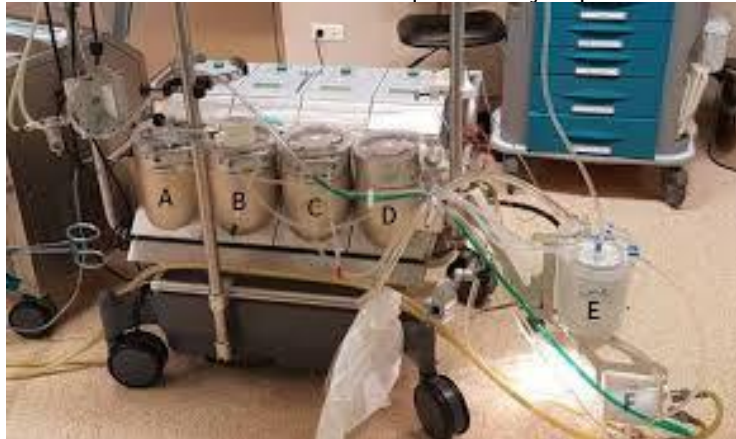
FIGURA 1 - Modelo de máquina coração-pulmão

Legenda: A – Aspirador aórtico, B – Aspirador de cardiectomia/campo operatório, C – Aspirador ventricular, D – Bomba arterial, E – Retorno venoso, F – Oxigenador de membrana