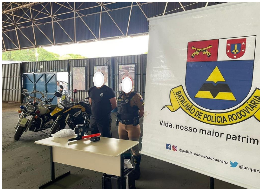
FIGURA 3: Slogan/Lema Batalhão de Polícia Rodoviária